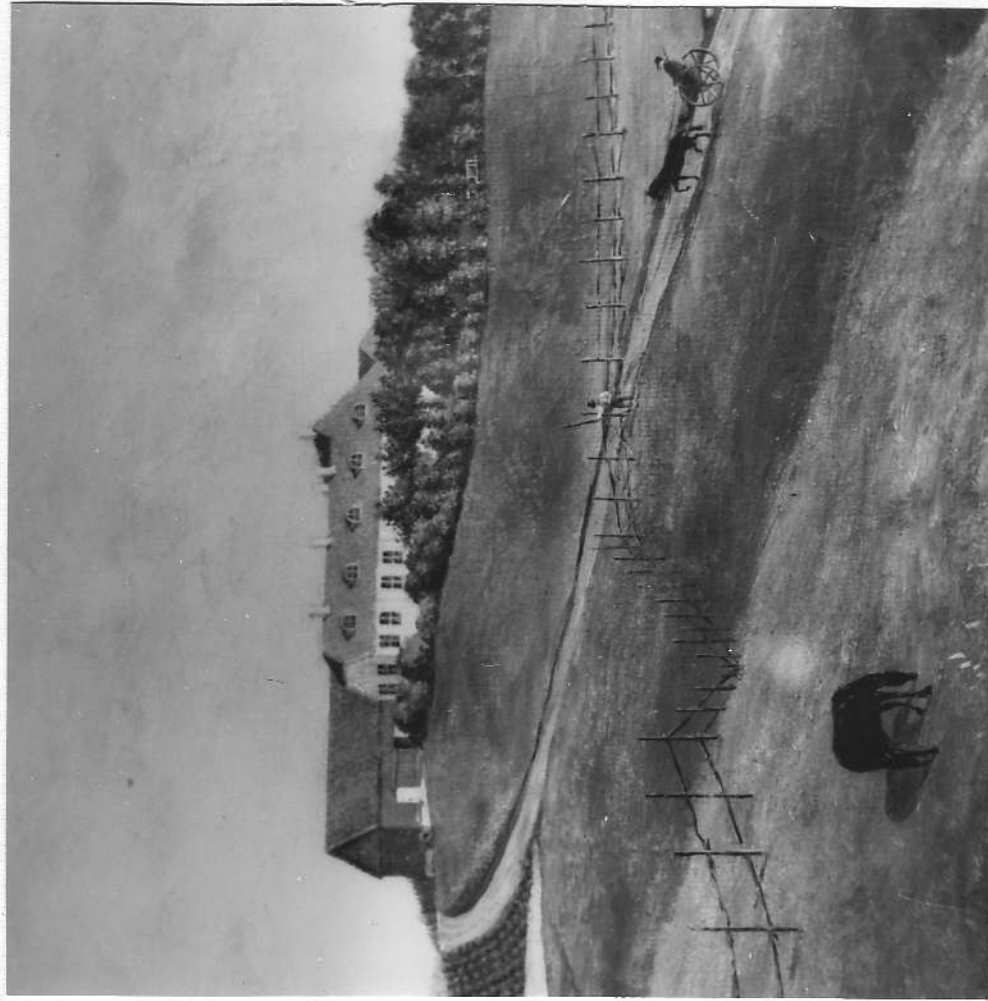
Waaler-eng Gaard etter gammel maleri

Vålerenga Historielag Postboks 9405, Vålerenga, 0610 Oslo. Postgirokonto: 0825 0617489