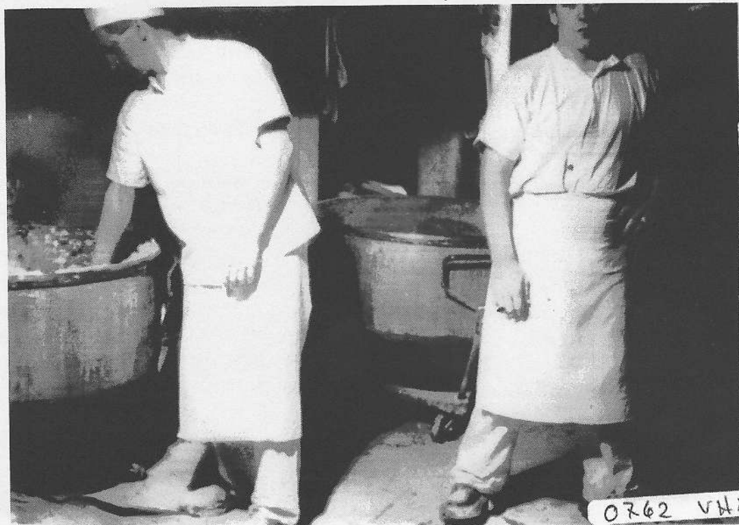
Bildet viser bakerne i full sving inne på det gamle bakeriet. (originalen har også avkappede hoder, men vi syntes bildet var verdt å bruke allikevel!

Det vakke lurt å prøve et brekk etter stenge-tid fordi det var en illsint grønlandshund i gården.