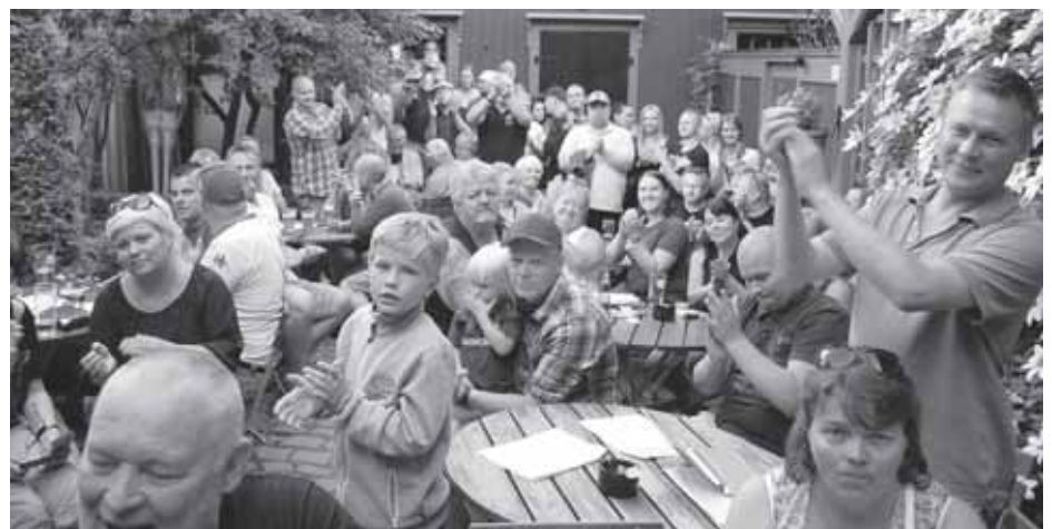
Stor stemning i bakgården på Vålerenga Vertshus i Hedmarksgata 1.