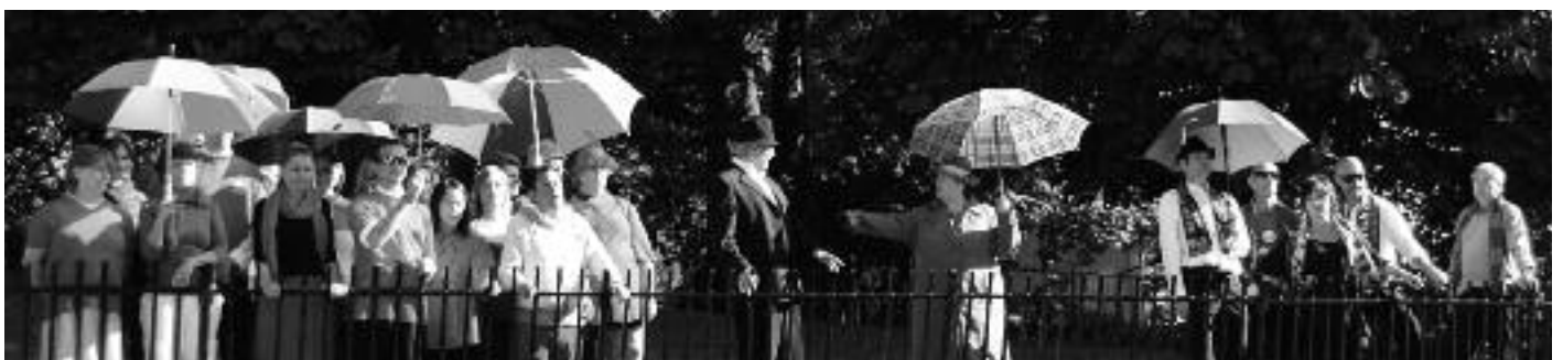
Akerselva Kultur- og Teaterlag ønsker igjen velkommen med nok en fantastisk oppsetning, denne gang i anledning VIF-jubileet.