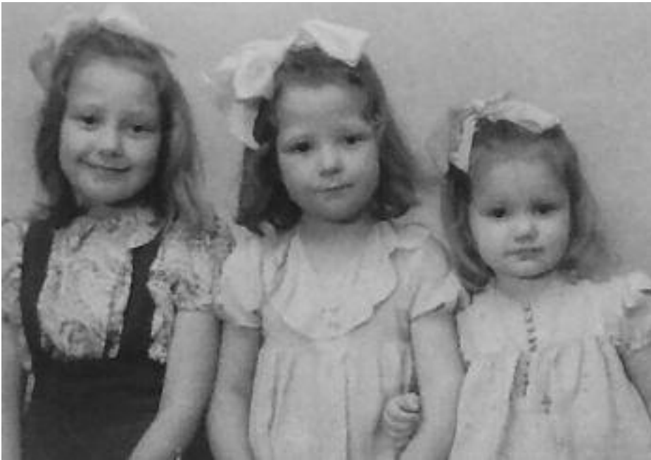
Her er de tre søte søstrene avbildet i tidlig barndom.