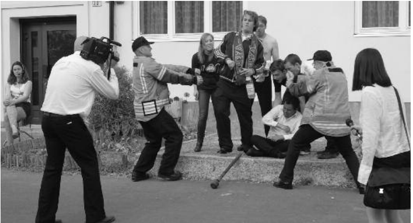
Da "Reka" og Co. satt fast i rådhusheisen i 2006. Her brekkes heisen opp av redningsmannskapene, og pressen strømmer til.