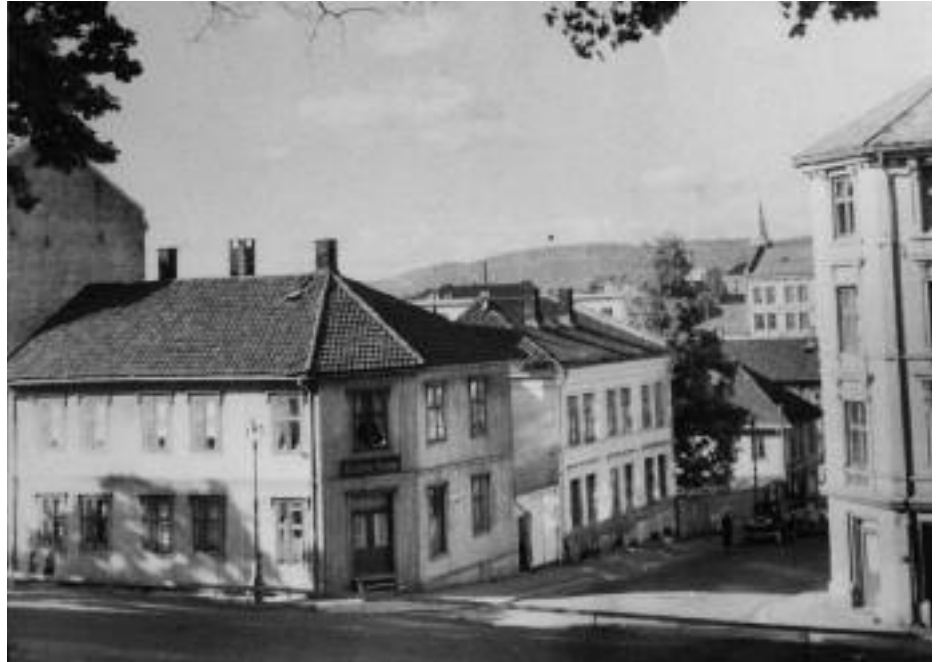
Ingeborgs gate 9 til venstre. en gang mellom 1955 og 1957.

Danmarks gate. I først etasje hadde en dame (Petrine?) trikotasjeforretning. Den var fortsatt i gang langt opp på 60-tallet. Over gangen i annen etasje holdt familien Larsen til. Sønnen Per underholdt med vakker pianomusikk, noe som vi barna koste oss med etter sengetid. Det var lytt. Felles utedo (3-4 dører) var ganske nifst på kveldstid. Uventet rottebesøk var lite trivelig.