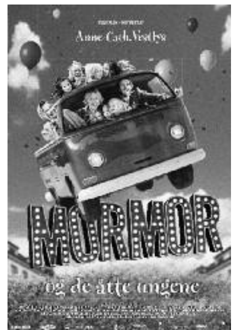
Kinoplakaten til filmen som er laget av Nordisk Film.

1948, det samme året Vålerengen Pikekor ble stiftet. Mangfoldige meter med mørk blått ullstoff ble forvandlet til pikekordrakter under mor Ingers kyndige fingre, og Marit - selvsagt medlem av koret fra dag