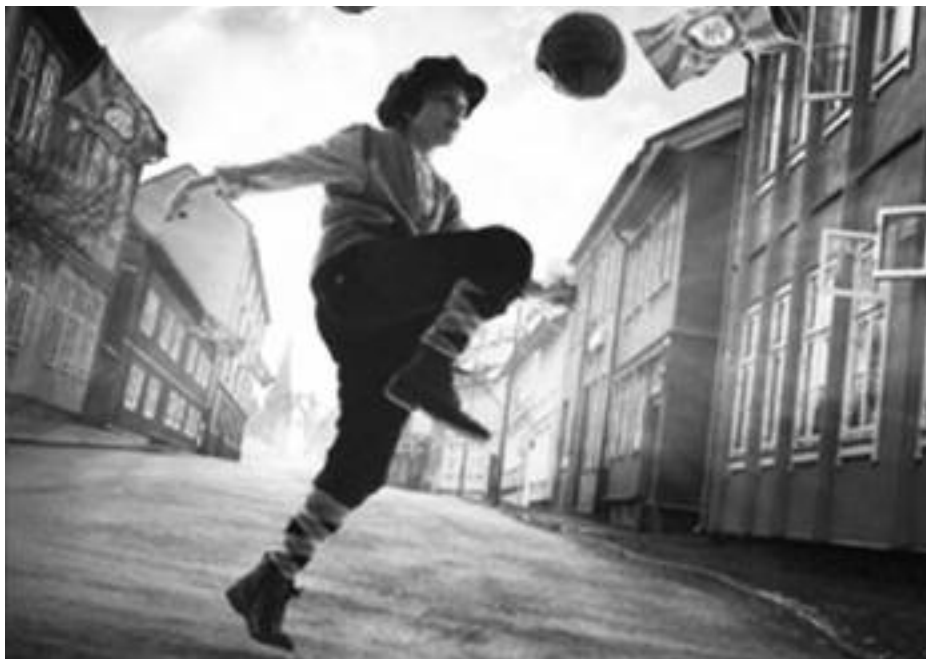
Fra Oslo Nyes plakat for stykket "Neste kamp". En kollasj fra Vålerengas gater.

Tekst: Jarle Teigøy.