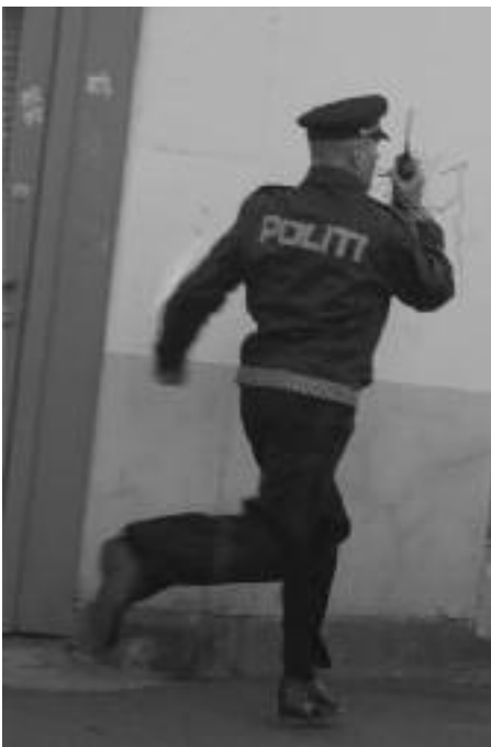
Stopp Skrik-tjuven!