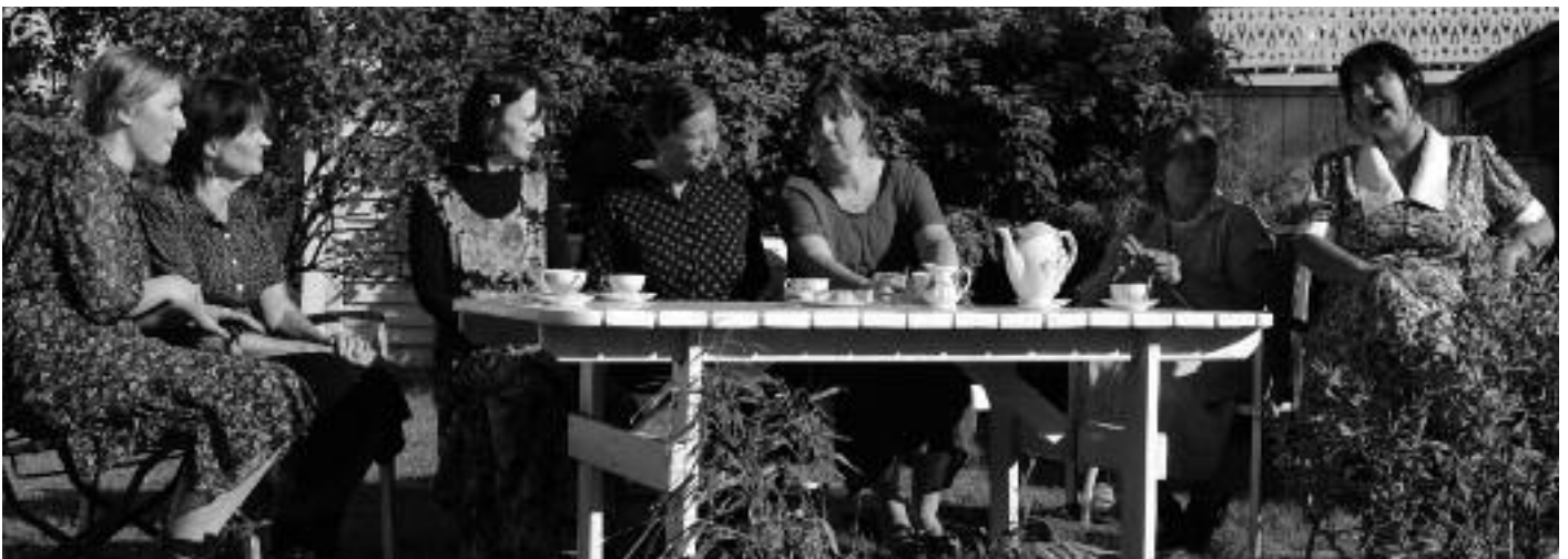
En scene fra en hage i Vålerengata. Nyinnflyttet trønder-frue har invitert kvinnene i nabolaget på kaffe.