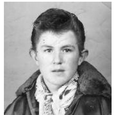
Allerede som 6-åring begynte han å interessere seg for trylling.