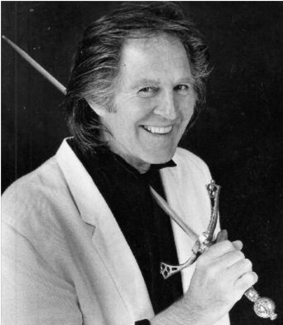
Tryllekunstneren fra Smålensgata slik vi kjenner han i dag.

Av Anne Teppen.