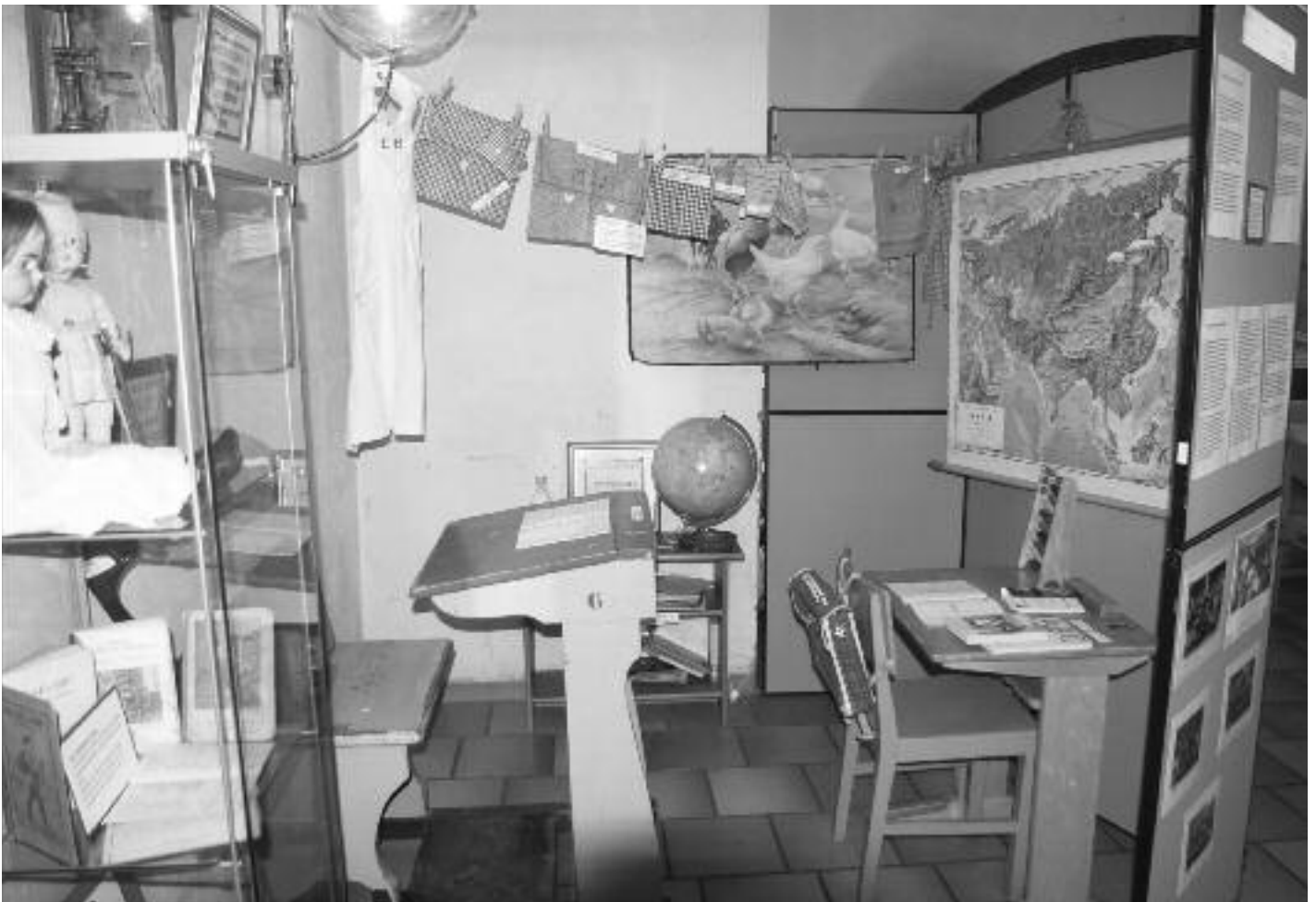
Skolen er viktig i et barns oppvekst. I dette hjørnet ble det gjenskapt et lite klasserom med flere gamle gjenstander.