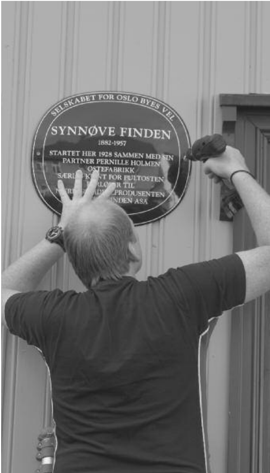
Oslo Byes Vels mann monterer det blå skiltet på husveggen i Danmarks gate 41. Nok et kulturminne er merket på Vålerenga.

I september ble det satt opp enda et blått emaljeskilt på Vålerenga. Det er etter hvert blitt mange av disse rundt omkring i byen, og det er Oslo Byes Vel som sørger for at kulturminnesmerker blir merket på denne måten.