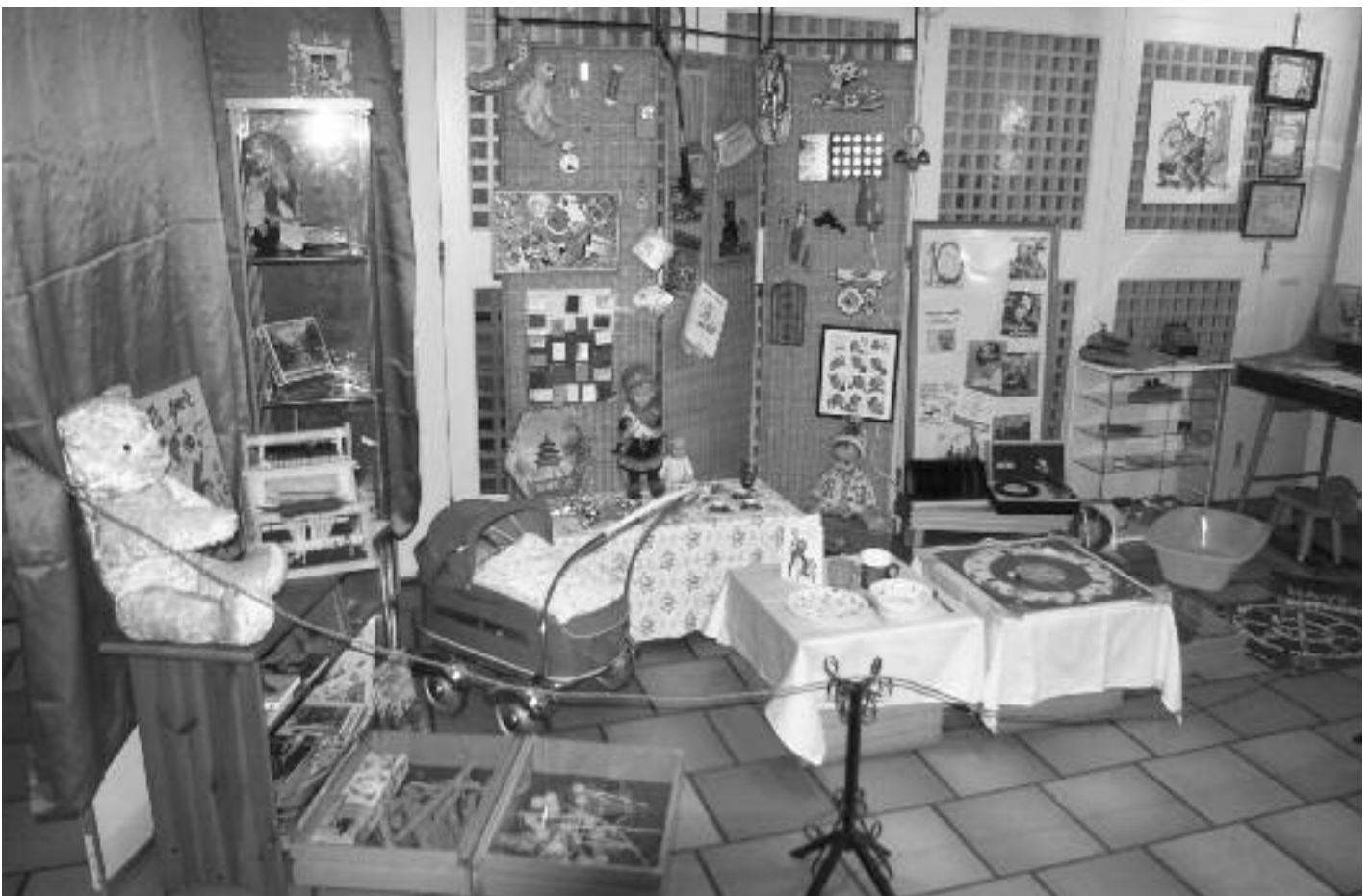
Barnerommet fra 1960-åra ble beskuet av mange på utstillinga.