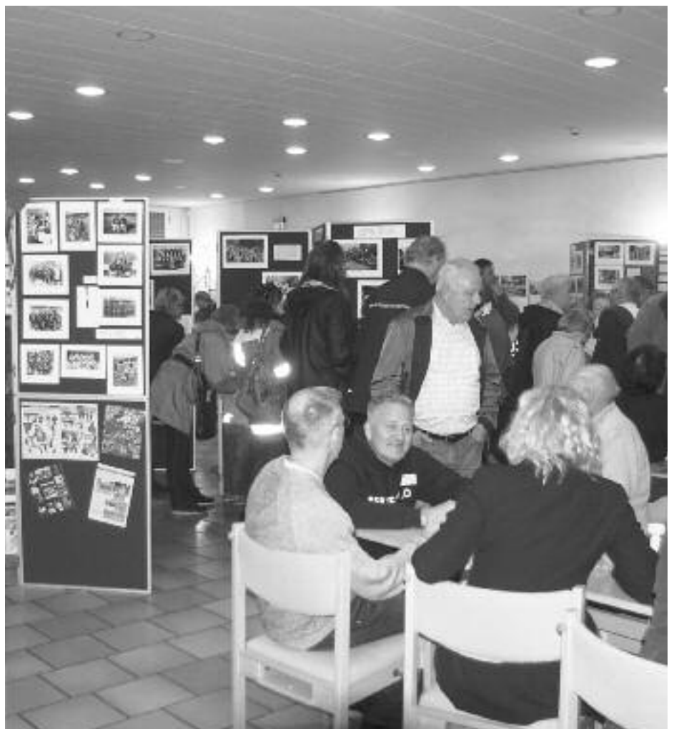
Godt besøk og god stemning også på årets utstilling.