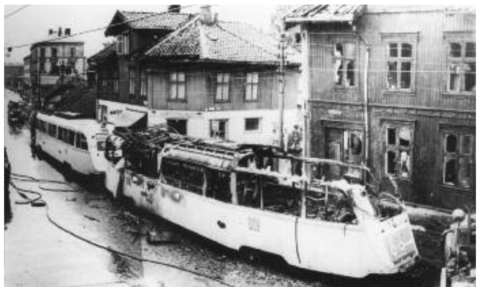
Trikkebrannen i Strømsveien 2. august 1958.